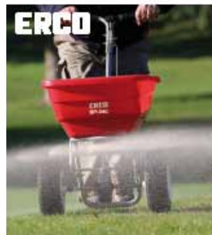
Innovativ und flexibel. Düng- und Streugeräte von ERGO