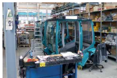
Die Fertigungstiefe bei Pfanzelt Maschinenbau ist sehr hoch. Schweißbaugruppen werden selbst produziert, Zahnräder gefertigt und Kabelbäume konfektioniert. Das Unternehmen beschäftigt 140 Mitarbeiter und hat 16 Auszubildende.