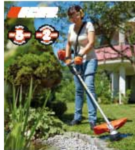
Motorsensen mit einzigartiger Langzeitgarantie, auch für Profis