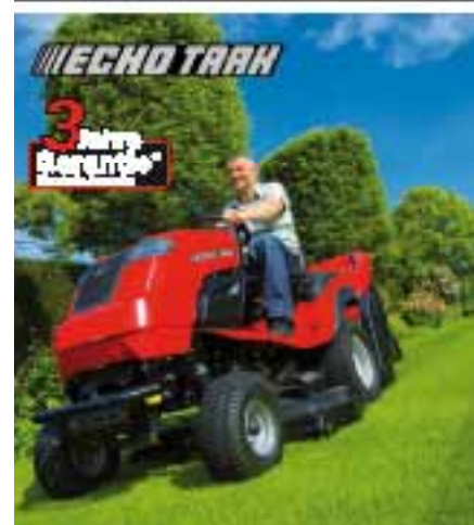
Perfekter Rasenpflegeaktor mit einzigartiger Rasenpflegemaschine

ROBUSTE TECHNIK FÜR RASEN-, GARTEN- UND GRUNDSTÜCKSPFLEGE