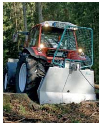
Neben professioneller Technik bietet Pfanzelt auch Produkte für Waldbauern an. Dies gilt sowohl für Seilwinden als auch für Rückewagen.

Es soll nicht unerwähnt bleiben: In diesem Jahr feiert Pfanzelt das 25-jährige Bestehen. Am 23. und 24. Juni wird das Firmenjubiläum in Rettenbach am Auerberg gefeiert. Ein vielfältiges Programm verspricht zwei interessante Tage. (jh)